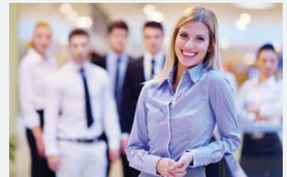
Managers in het MKB